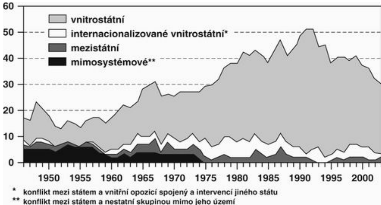
Obrázek č. 1: Vývoj konfliktů podle jejich charakteru v letech 1945 – 2005

silách (39 %), u policie, vzbouřenců a nebo u jiných nestátních sil. Malé a lehké zbraně představují velký obchod. Ročně se vyprodukuje téměř sedm milionů kusů ručních zbraní. Vyrábí se v 90 státech, 75 % z nich pochází z USA a EU. Černý trh s malými zbraněmi se podle odhadů pohybuje od dvou do deseti miliard dolarů ročně. Jenom v Afghánistánu je okolo 10 milionů kusů těchto zbraní, v západní Africe přibližně sedm a ve Střední Americe dva miliony kusů. (Tyto zbraně jsou levné – v některých zemích lze samopal AK-47 „kalašnikov“ koupit za pytel kukuřice nebo za 20 až 30 amerických dolarů.)