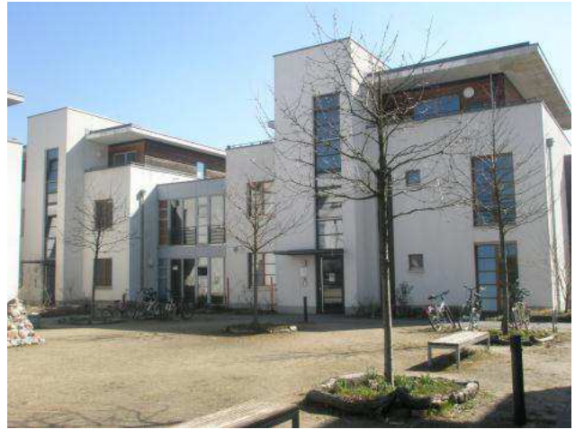
Zařízení pro postižené

Po dobu pobytu jsme pracovaly ve třech zařízeních. V každém jsme strávily jeden měsíc. Nejprve se naskytla možnost pracovat v zařízení (Kinder- und Jugendhaus) pro tělesně i duševně postižené děti. Naší hlavní náplní byla jednak zdravotní péče – pomoc klientům při hygieně, péče o lůžko, pomoc při podávání stravy a péče o pokožku klientů, kteří měli značné potíže s hybností. Dále jsme klientům poskytovali bezpečný doprovod při procházkách, při sportovních aktivitách, nákupech, výletech, návštěvách diskoték, které se konaly v areálu zařízení a mnoho podobných činností.