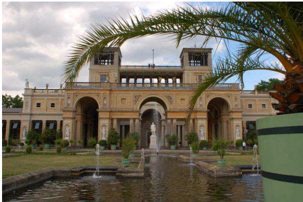
okolí zámku Sanssouci