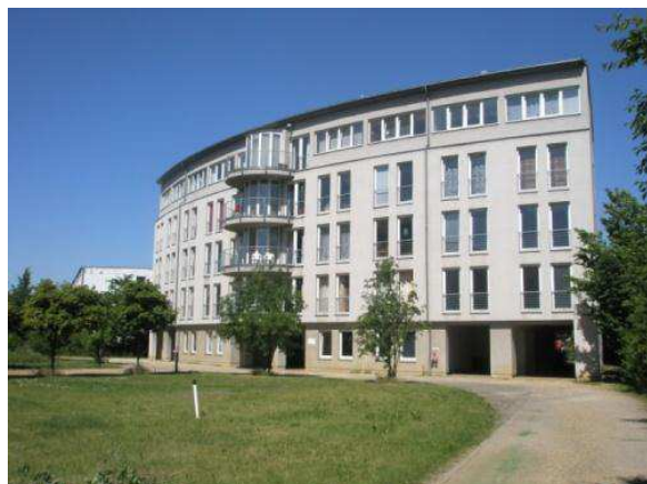
Budova, ve které jsme byly ubytované

Tento rok jsme byly ubytované společností EJF, u které jsme vykonávaly praxi. Bydlely jsme v zařízení pro postižené osoby, a měly jsme vyhrazené jedno patro, kde jsme každá měla svůj pokoj, společnou koupelnu na chodbě a kuchyň. Se zařízením jsme byly velmi spokojené. Měsíčně jsme platily 80 €.