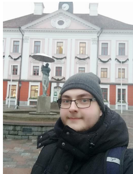
Náměstí v Tartu se slavnou fontánou