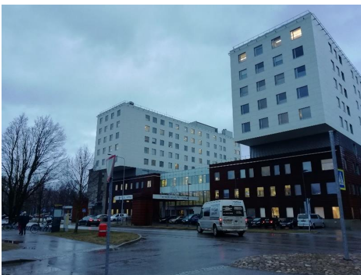
Univerzitní nemocnice Tartu