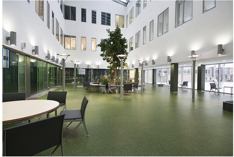
Atrium oddělení radiologie