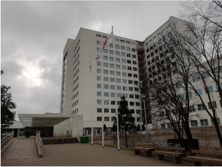
Severní budova Tallinnské nemocnice