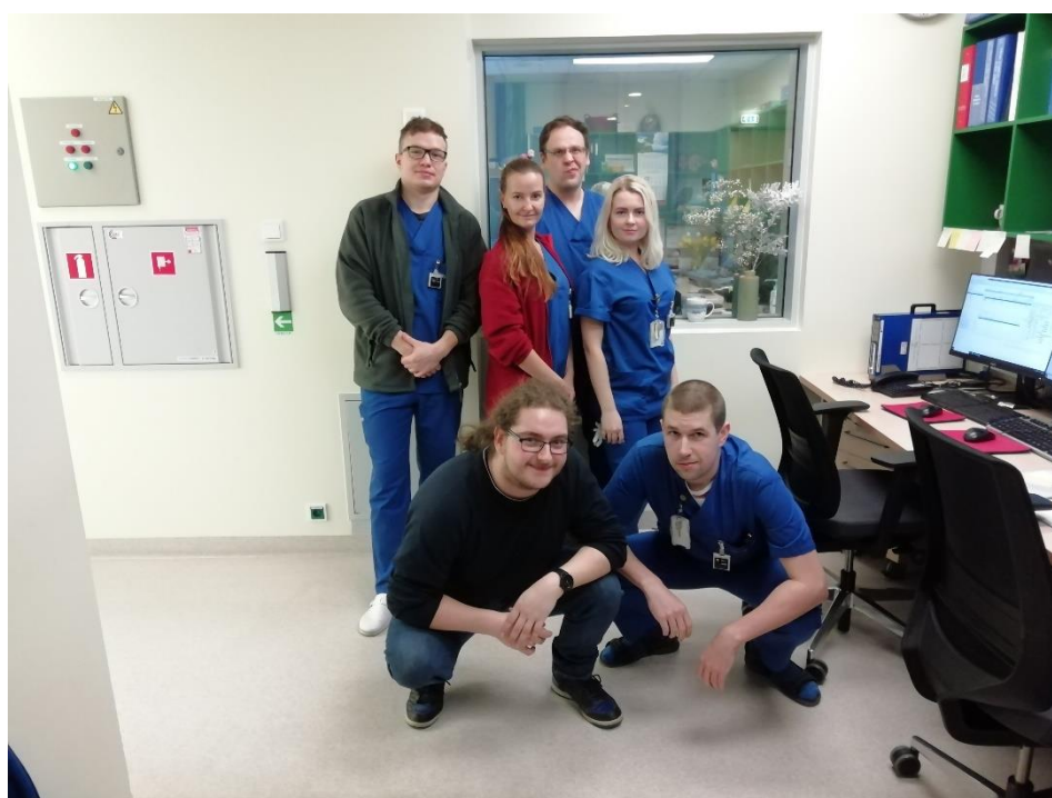
Fotografie s kolegy z pracoviště ozařování