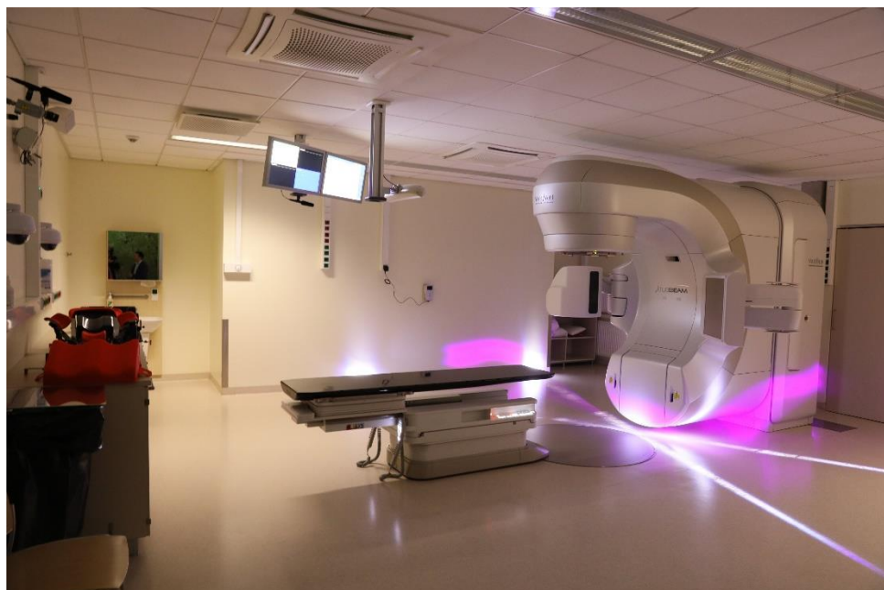
Jeden ze 4 lineárních urychlovačů v Tallinnské nemocnici