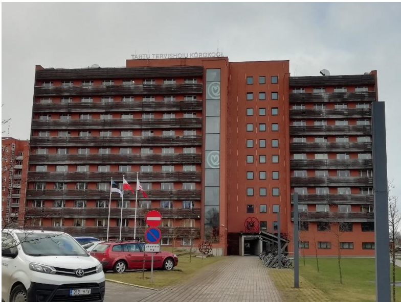
Studentské koleje a budova univerzity