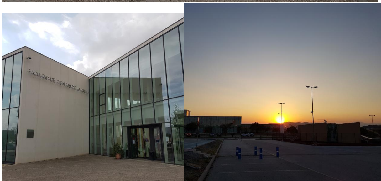
Fakulta zdravotnických věd v Malaze. Cca 45 minut tramvají a metrem od centra.