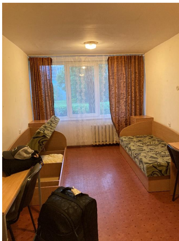
Pokoj na koleji