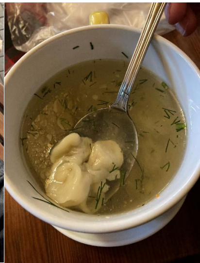
Polėvka s knedlíčky