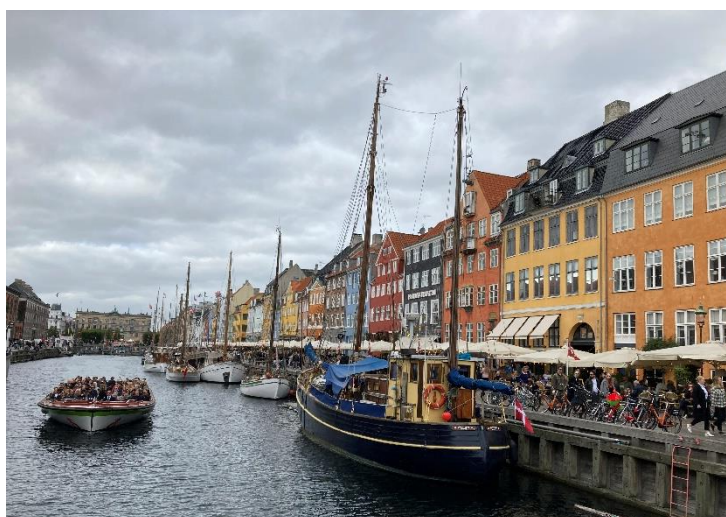
Nyhavn – Kodaň