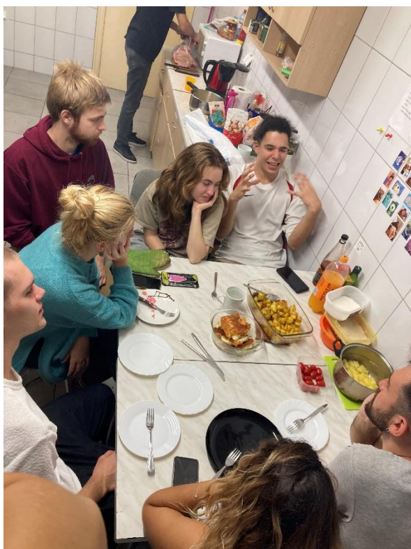
Společná večeře v kuchyňce na koleji – smažák

Tím, že skoro všichni erasmáci bydleli na stejném patře na stejné kolejích, jsme spolu trávili čas prakticky pořád. Celkem často jsme navštěvovali studentský klub Dzem pub, kde se schází většina erasmus studentů i z ostatních univerzit. V úterý karaoke, ve čtvrtek beerpong... Another day, another party..