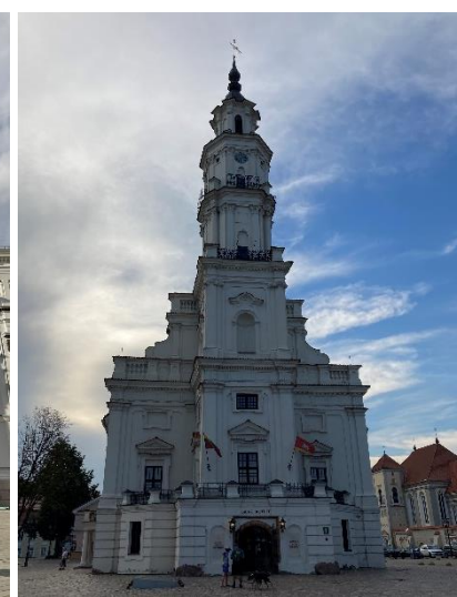
The Town Hall of Kaunas