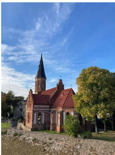
Vytutatus Magnus Church