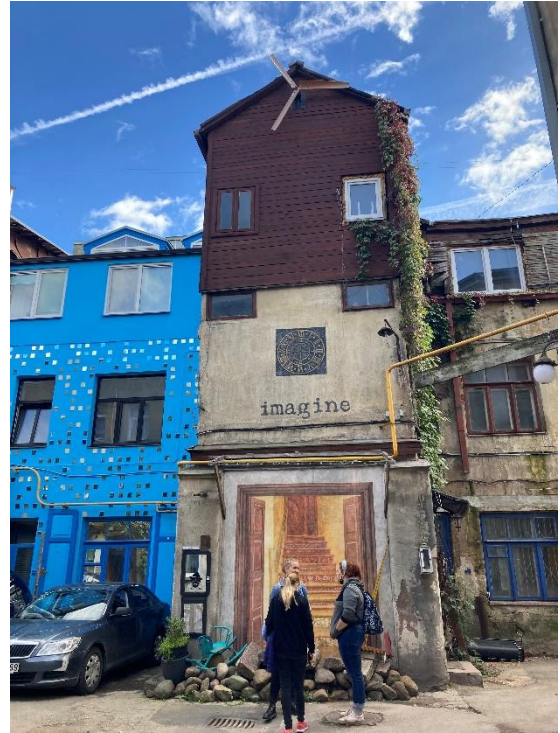
Street art, Kaunas