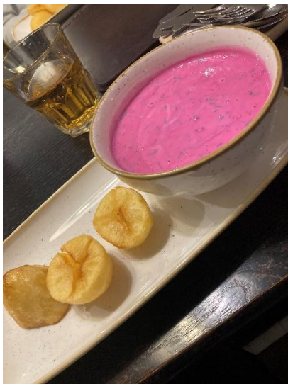
Cold beetroot soup

Tradiční jídlo: Restaurace s typickým/tradičním litevským jídlem jsou často ve větších nákupních střediskách (Molas, Akropolis), kde se dá najíst dobře, za přijatelnou cenu a máte možnost toho vyzkoušet více.