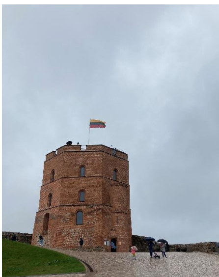
Gediminas Castle Tower – Vilnius

(Pro tipy na další výlety mrkněte na závěrečnou zprávu od Míši a Dana)