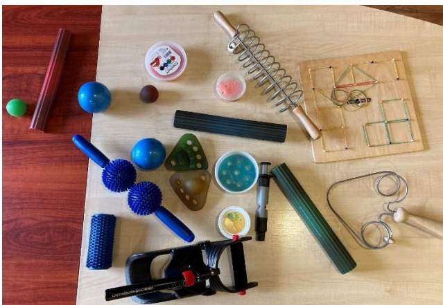
Vybavení – terapie ruky