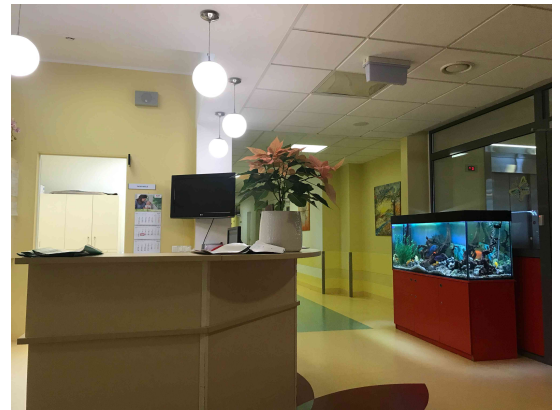
Sesterna na dětské hematologii