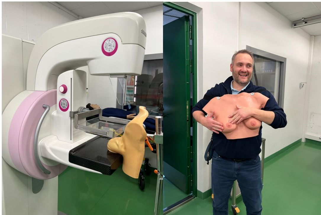
Mamograf určený pro simulaci

Po exkurzi nás čekala první přednáška, ze které jsme si odnesly nové poznatky. Po ukončení programu jsme se vydaly prozkoumat město a nakoupit si základní potraviny.