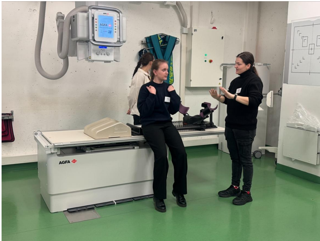
Simulace na téma „Radioterapie“

V odpoledním programu nás čekala exkurze do místní nemocnice na oddělení diagnostiky a radioterapie. Výbava nemocnice byla srovnatelná s Nemocnicí České Budějovice, ale prostředí působilo příjemněji.