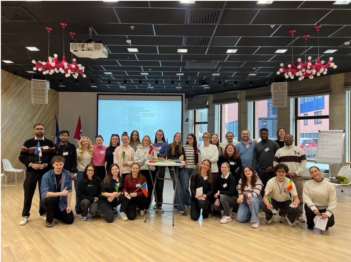
Studenti a vyučující z Pákistánu, Estonska, České republiky, Litvy, Nizozemska a Belgie

Zúčastnily jsme se týdenního Erasmus+ (Blended Intensive Programme) programu s názvem Interdisciplinary Approach in Musculoskeletal Physiotherapy: A Key Factor in Breast Cancer Radiotherapy v univerzitním městě Tartu. Programu se účastnili jak studenti fyzioterapie, tak studenti radiologické asistence.