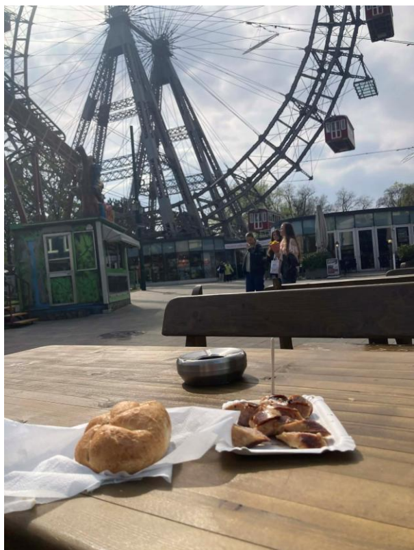
1 - Bratwurst v Prateru

Vídeň má skvěle vyřešenou hromadnou dopravu, takže se dostanete opravdu všude. Já jsem na cestách i v rámci dojíždění do práce denně strávila spoustu času a před odjezdem jsem poměrně intenzivně řešila, jakou jízdenku si koupit, aby to vyšlo co nejvýhodněji. Od letošního roku bohužel přestala platit tzv. Semester Ticket na celý semestr za super cenu. Nejvýhodněji mi tedy vyšlo koupit si 2x měsíční jízdenku za 65 euro (=130 euro). Na tenhle typ nepotřebujete (neuplatníte) žádný studentský průkaz...ani ten, který nám byl nabízen ze strany FH Campus Wien před samotným příjezdem – takže jsem se rozhodla si ho nezařizovat, a nakonec jsem ho opravdu v žádných ohledech nepotřebovala. Každopádně vřele doporučuji appku WienMobil – na spoje, trasy, jízdenky.