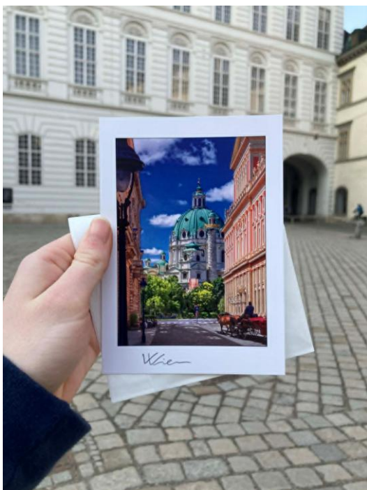
3 - Pohlednice domů